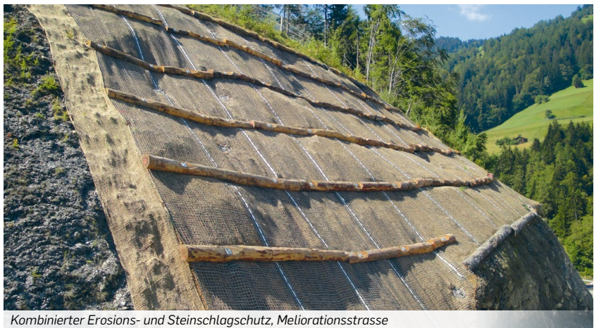
Kombinierter Erosions- und Steinschlagschutz, Meliorationsstrasse